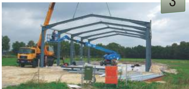
Montage der Stahlkonstruktion